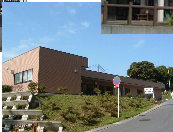
浜名学園なぎさ作業所▶ (就労継続支援B型事業所)