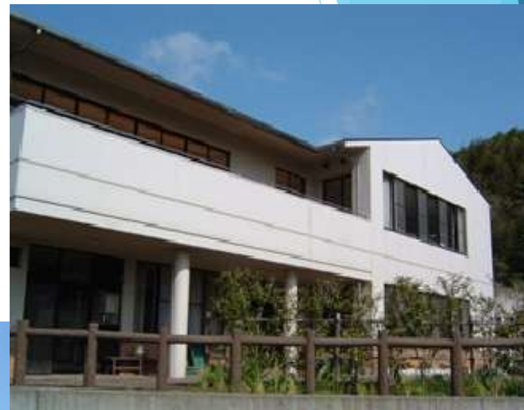
▲浜名学園きぼう (生活介護事業所)