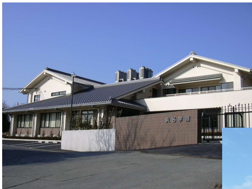
▲浜名学園（障害者支援施設）