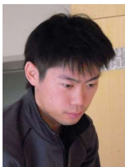
浜名学園 生活支援員

障害者を取り巻く環境は変化しておりますが、変わらないのは、ご利用者ひとりひとりの尊厳を守り、豊かでやすらぎのある生活を目指すという理念です。今後も職員一同、その理念を胸に精一杯努力してまいりますので、ご支援とご協力をよろしくお願いいたします。